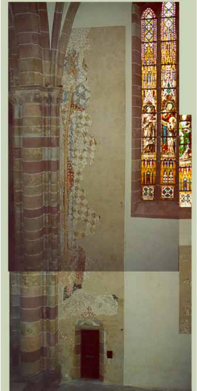
Après travaux de restauration