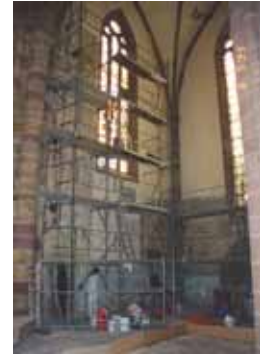
Pendant travaux de dégagement et restauration

MEMBRE DE LA COMPAGNIE DES ARCHITECTES EN CHEF DES MONUMENTS HISTORIQUES