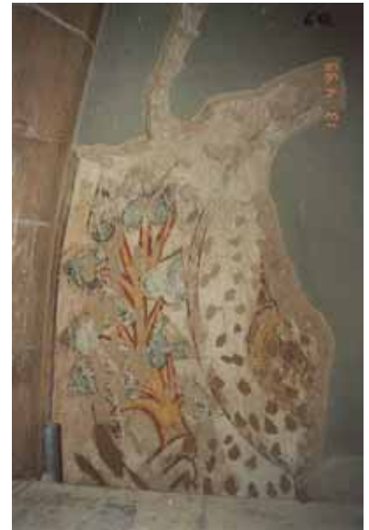
Pendant travaux de restauration