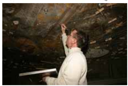
Intégration par retouche des fixations et des câbles