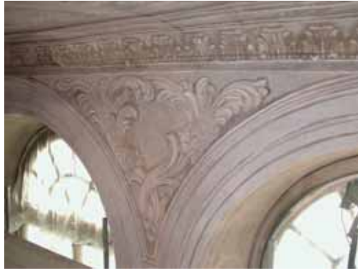
Pendant travaux de restauration