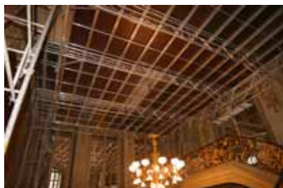
Pendant travaux de restauration