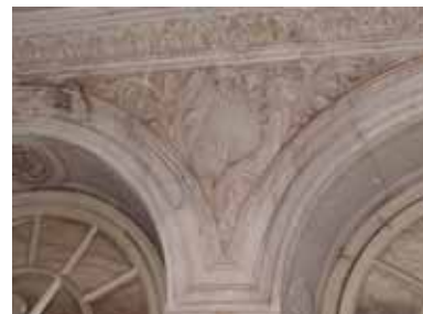
Avant travaux de restauration