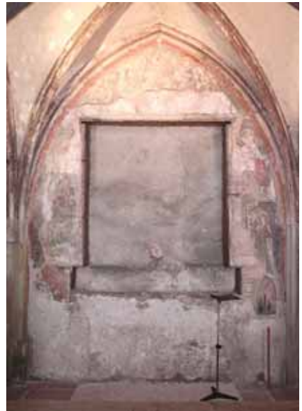
Avant travaux de restauration