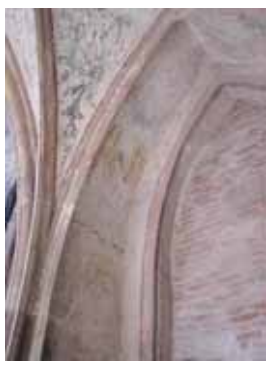
Après travaux de restauration