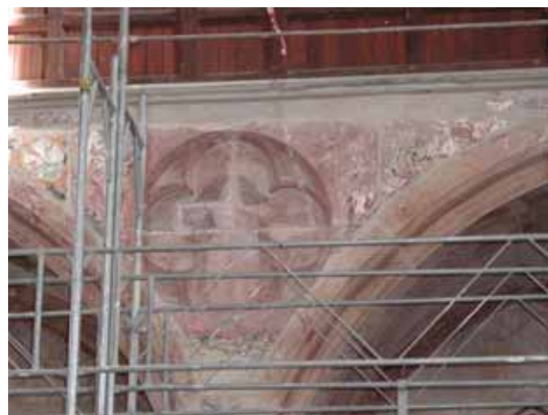
Durant travaux de restauration