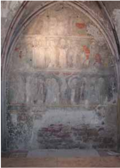
Avant travaux de restauration