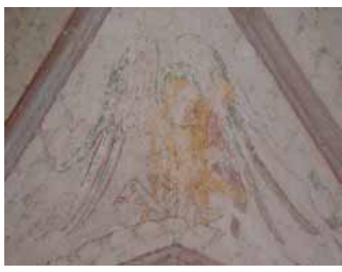
Après travaux de restauration