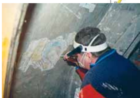
Durant travaux de restauration