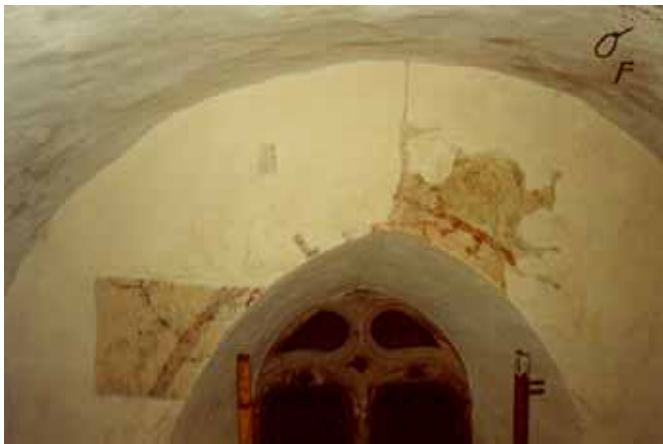
Pendant travaux de dégagement