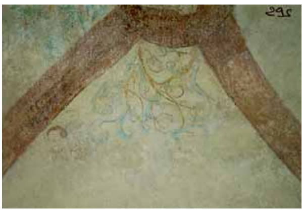
Après travaux de restauration