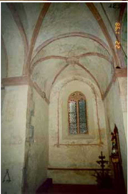
Après travaux de restauration