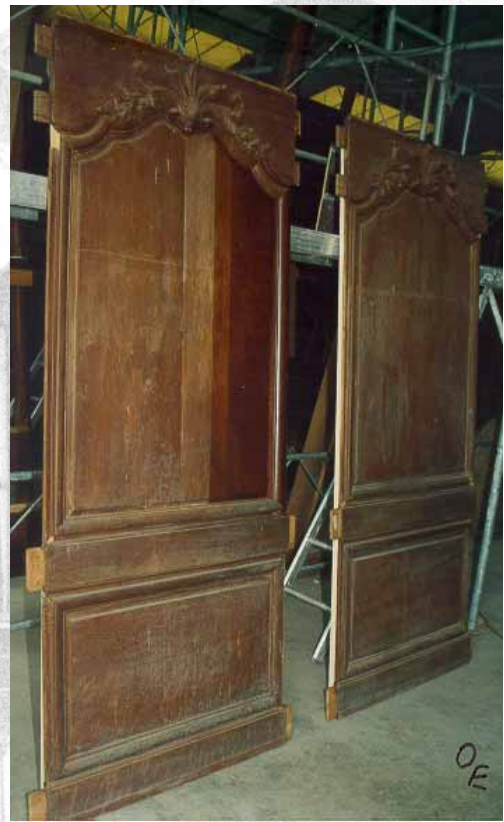
Pendant travaux de restauration réalisés en atelier