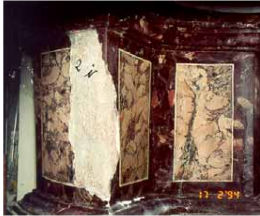
État des dégradations avant travaux