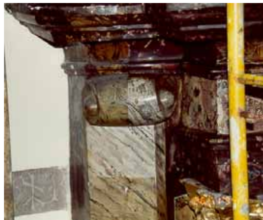
Pendant travaux : nettoyage et dépose des vernis