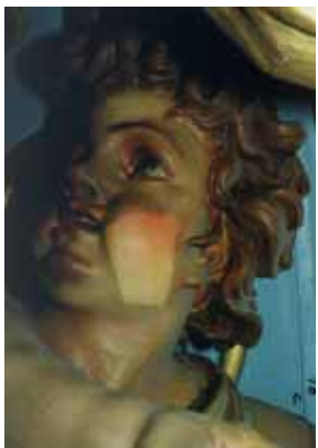
Pendant travaux de restauration