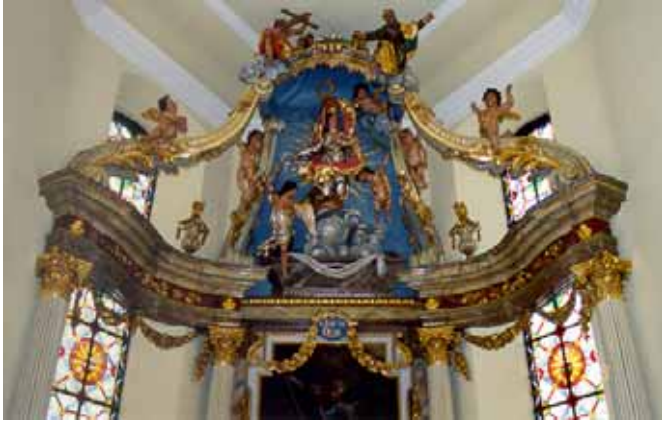
Après travaux de restauration