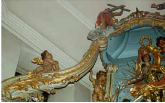
Avant travaux de restauration