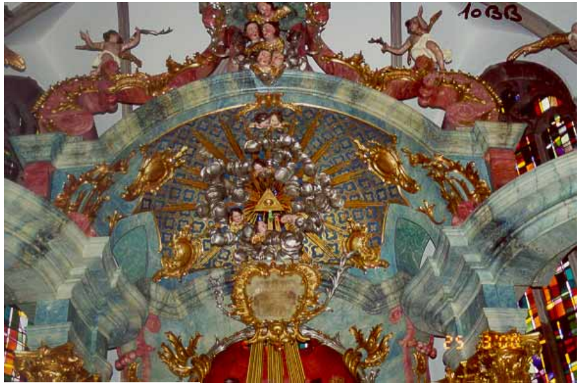
Après travaux de restauration