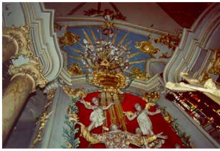
Avant travaux de restauration