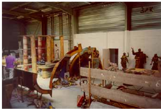
Restauration en atelier et transport