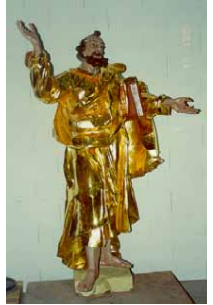
Pendant travaux de restauration