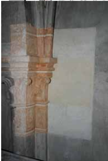
Synthèse et reconstitution de décors