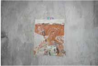
Travaux de reconnaissance des décors peints