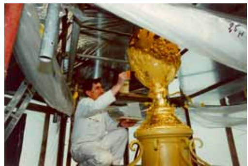
Pendant travaux de dorure