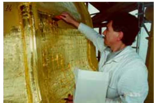
Après travaux de dorure