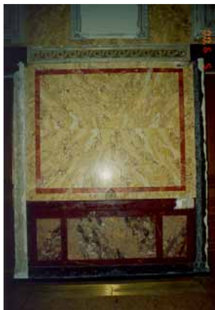
Nettoyage du stuc marbre