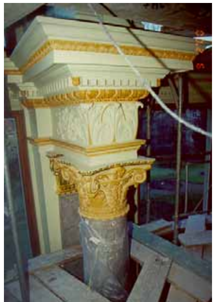
Pendant travaux de restauration