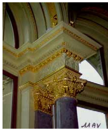
Après travaux de restauration