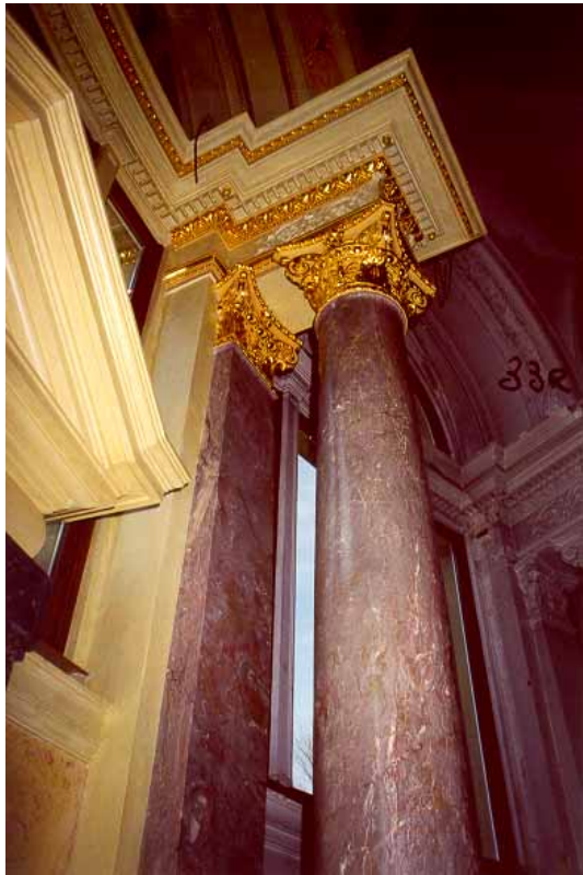
Après travaux de dégagement et restauration