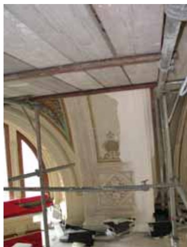
Pendant travaux de restauration