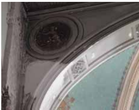
Avant travaux de restauration