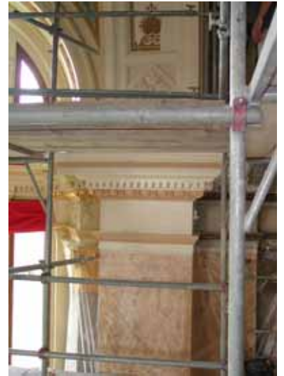
Pendant travaux de restauration