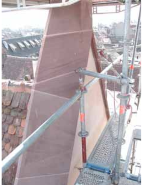
Pendant travaux de restauration