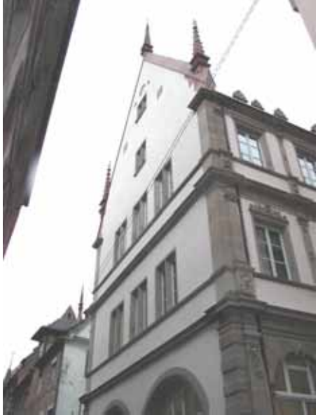
Après travaux de restauration