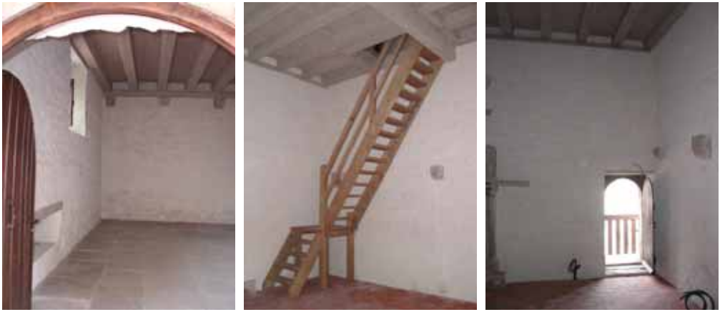
Après travaux de restauration