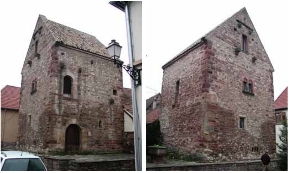
Avant travaux de restauration