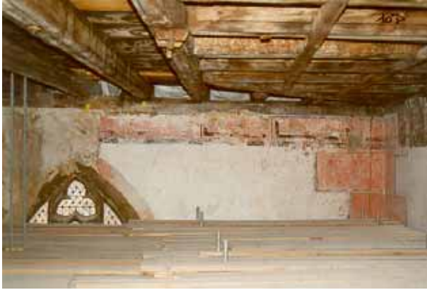
Pendant travaux de dégagement