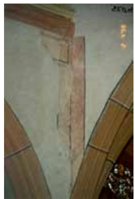
Détails après restauration