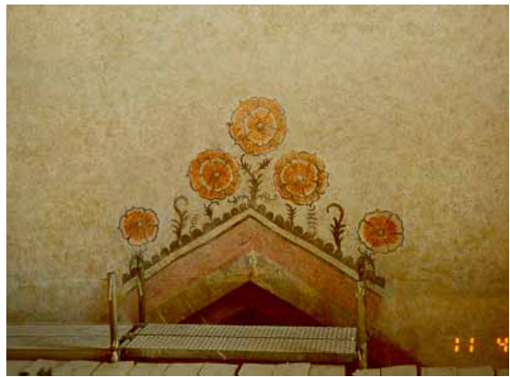
Après travaux de restauration