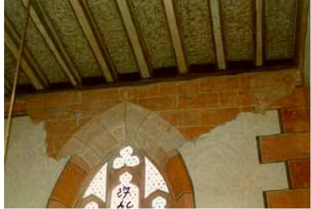
Après travaux de restauration