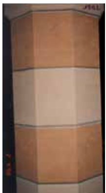
Détails après restauration