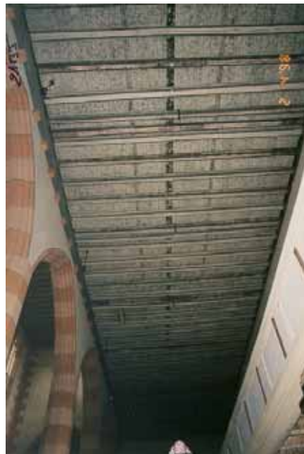
Après travaux de restauration