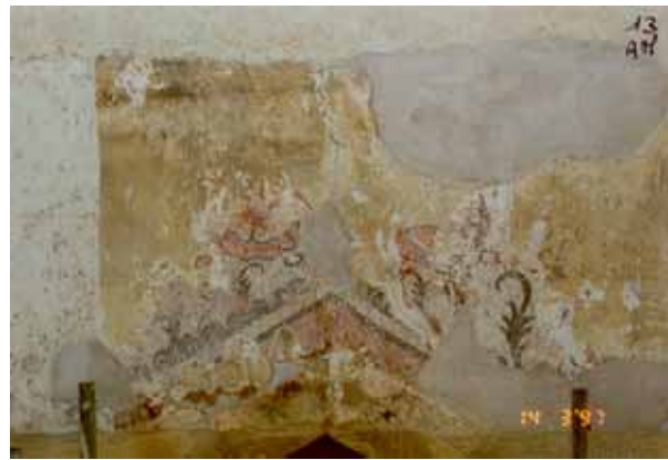
Pendant travaux de dégagement et restauration