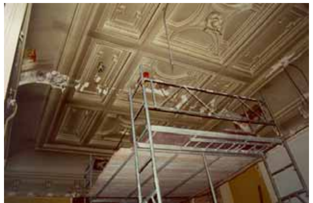
Pendant travaux de restauration