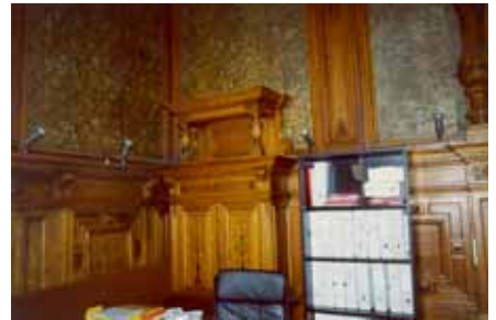
Avant travaux de restauration