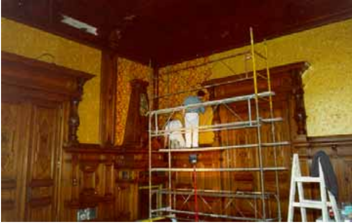
Pendant travaux de restauration