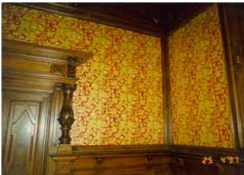
Après travaux de restauration