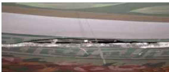
Avant travaux de restauration