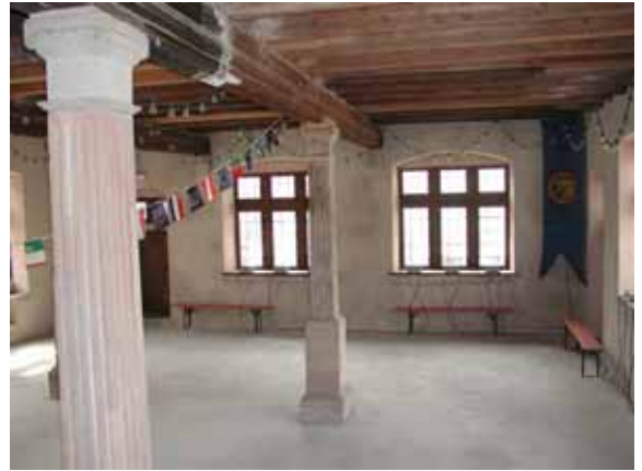
Avant travaux de restauration