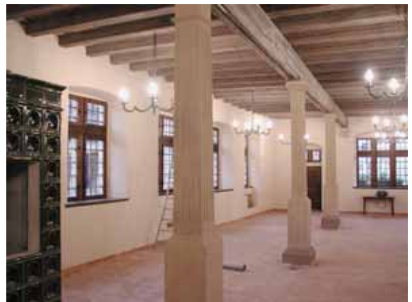
Après travaux de restauration