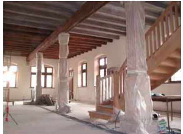
Pendant travaux de restauration